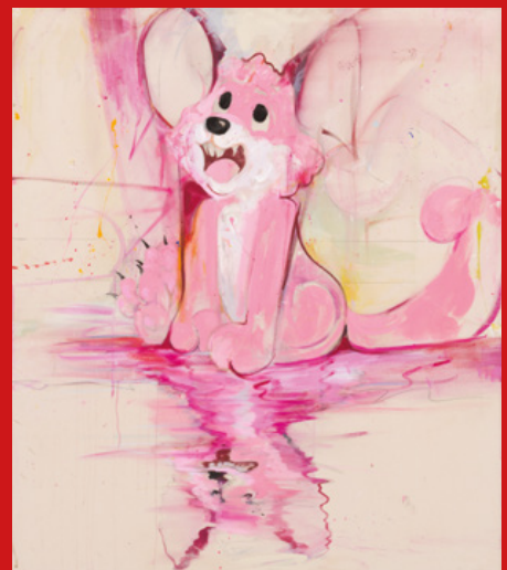
Szabolcs Bozó, In The Shadows, 2026 - Acrylic and metallic paint on canvas