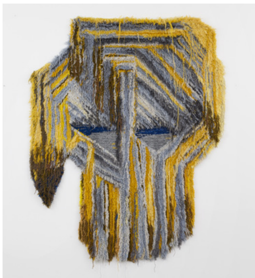
Caroline Achaintre, Brutus - 2016 Laine tuftée à la main - 223 x 180 cm Collection Fondation Villa Datriis