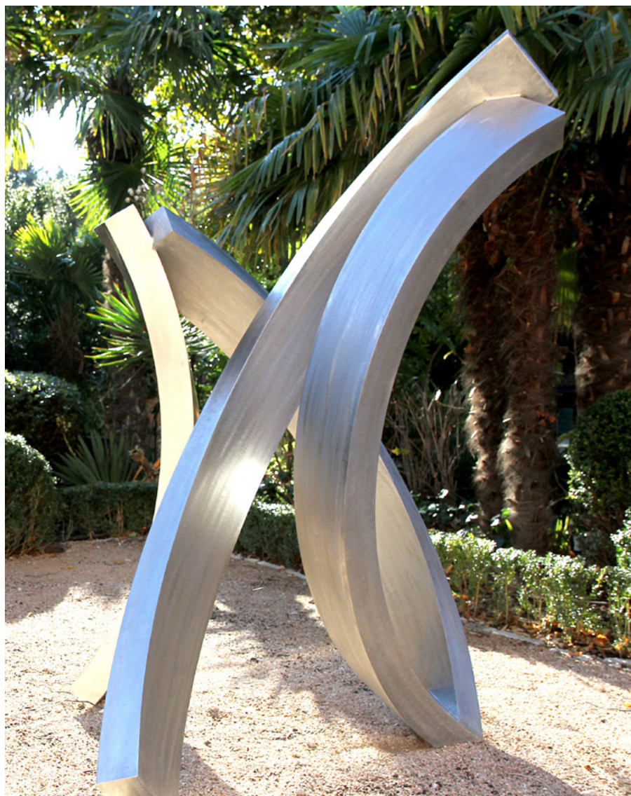
Stéphane Guiran , Quatrain 2011 - Inox - 200 x 150 x 150 cm - Collection privée

« La Villa et sa programmation généreuse font partie de notre histoire depuis dix ans. Des années fortes qui ont montré que la sculpture est un matériau humain habité de rêves et d'amitié ». Stéphane Guiran