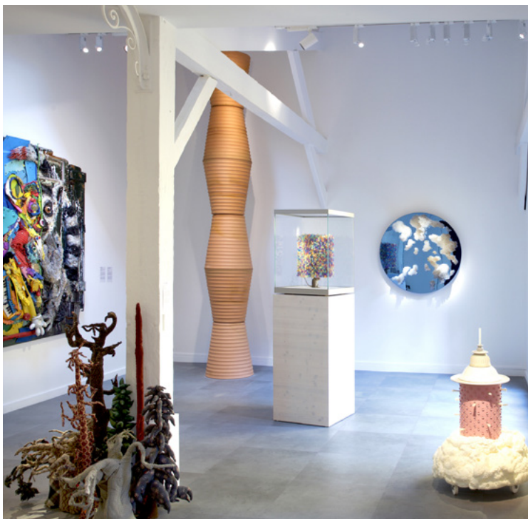
Vue de salle, Bouteille plastique à la mer , Exposition Recyclage/Surcyclage , Espace Monte-Cristo.

Fidèle à l'esprit chaleureux et accueillant qui caractérise la Villa Datris à l'Isle-sur-la-Sorgue, l'Espace Monte-Cristo organise des activités invitant à la découverte: visites, conférences, workshops, lectures et ateliers créatifs. Enrichi chaque année de nouvelles œuvres et de nouveaux artistes, l'Espace Monte-Cristo confirme au rythme de ses expositions sa mission de promotion et de partage de la sculpture contemporaine.