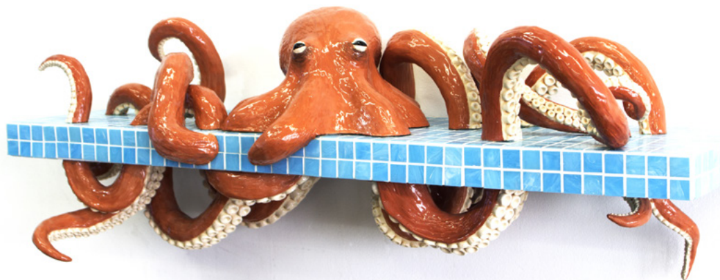
Sébastien Gouju , Le Poulpe - 2015 - Faïence émaillée - 32 x 90 x 30 cm Collection Fondation Villa Datris - Photo © Franck Couvreur © ADAGP, Paris - 2021

Nous découvrons ici des artistes qui s'interrogent et s'expriment sur leur relation à notre environnement. A travers leur regard se matérialisent les multiples facettes de cette nature, à la fois paisible, tumultueuse, inquiétante et menacée.