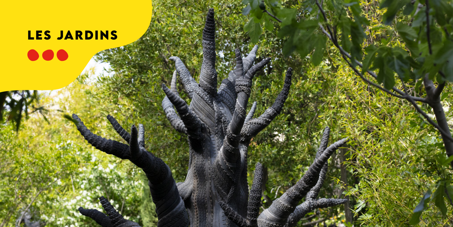
Anne Claverie , Arbrabra 2013 - Pneus et structure en métal - 380 x Diam. 200 cm Collection Fondation Villa Datriis - Photo © Tim Perceval

Chaque année, les jardins de la Villa Datriis permettent de découvrir de nombreuses sculptures en lien avec le thème de l'exposition.