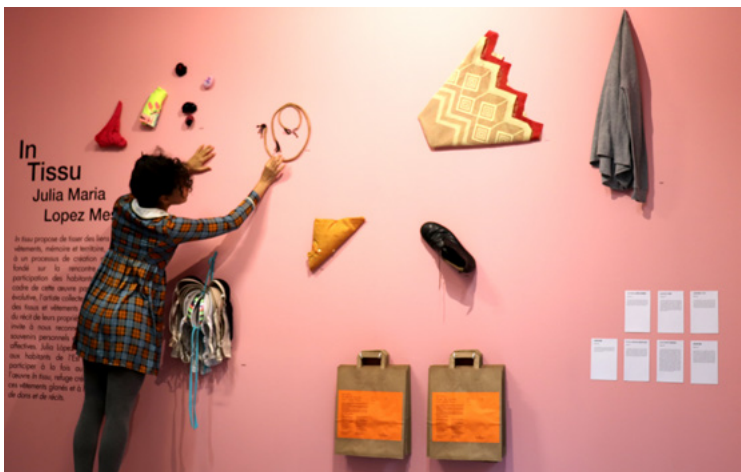
Julia Maria Lopez Mesa , In Tissu (détail), 2020, Tissus, bois, grilles plastiques - 270 x 200 x 200 cm Production courtesy de l'artiste