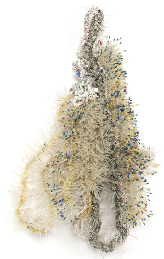
Moffat Takadiwa , Smell Fighters (a) - 2017 Aérosols et tubes de dentifrice - 190 x 120 x 24 cm Collection Fondation Villa Datris

C'est une collection de sculpture contemporaine, comme toujours à la Villa Datris, c'est le reflet et la mémoire de nos expositions, des œuvres que nous aimons, qu'elles soient abstraites, souvent, ou figuratives, rarement, elles sont cinétiques, mobiles, lumineuses, colorées ou numériques. Toutes racontent une histoire, une démarche d'artistes inspirés, créatifs et engagés.