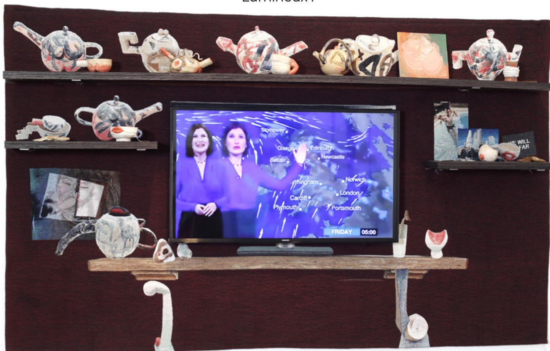
Laure Prouvost , The TV Mantelpiece - 2016 Tapisserie, étagère, céramique, écran télévision, sachets de thé, couteau, acrylique, peintures, pierre, vidéo 140 x 238 x 20 cm Edition 2/3 + 1 AP Collection privée Photo © Franck Couvreur © Laure Prouvost, ADAGP, Paris - 2021