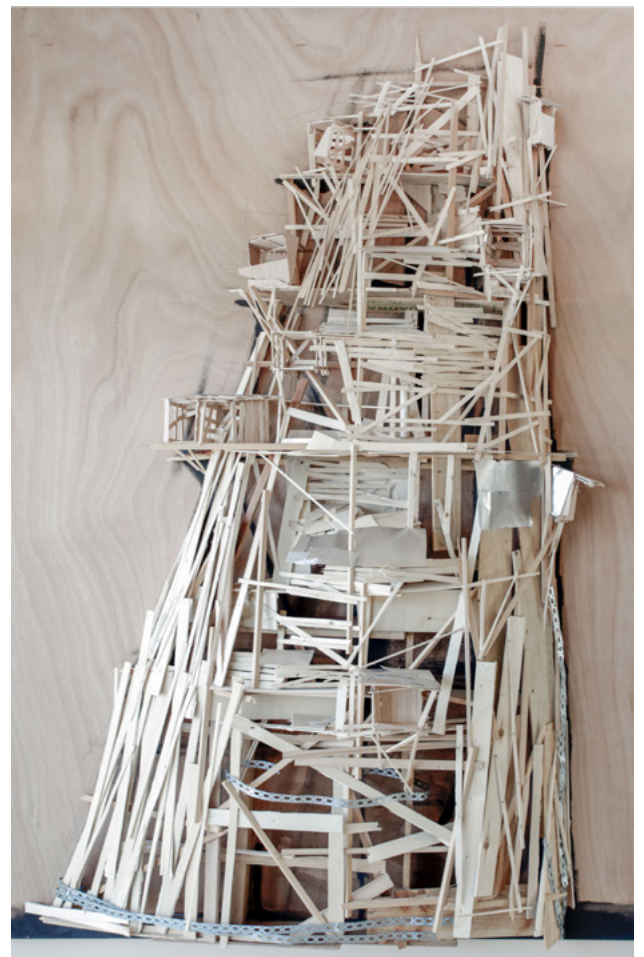
Tadashi Kawamata , Collective Folie La Villette 2014 - Balsa et peinture sur contreplaqué - 210 x 153 x 10 cm Collection privée - Photo © Tim Perceval

Les frontières s'estompent : architecture ou sculpture ?