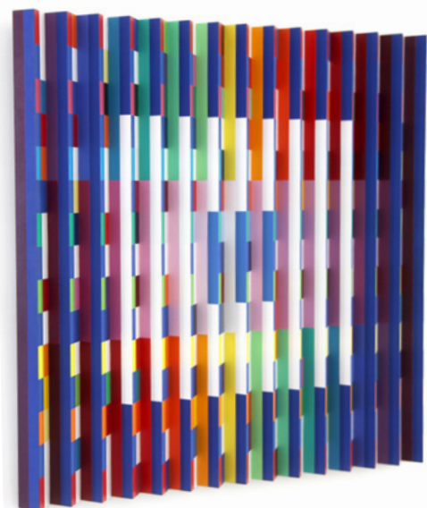
Yacoov Agam, Carré bleu 1977 - Huile sur relief, aluminium - 60 x 60 cm Collection privée © Yacoov Agam, ADAGP, Paris - 2021