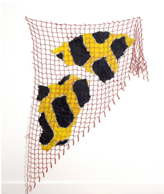
Claude Viallat, 033F1985 - 1985 Acrylique sur papier japon et filet de pêche - 210 x 210 cm Collection Fondation Villa Datris