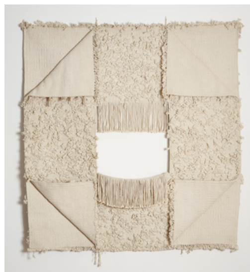
Pierre Daquin, Quatre coins pliés - 1969 - Coton 150 x 150 cm - Collection Fondation Villa Datriis © Pierre Daquin, ADAGP, Paris - 2021

Une belle invitation à s'ouvrir et à sortir du cadre !