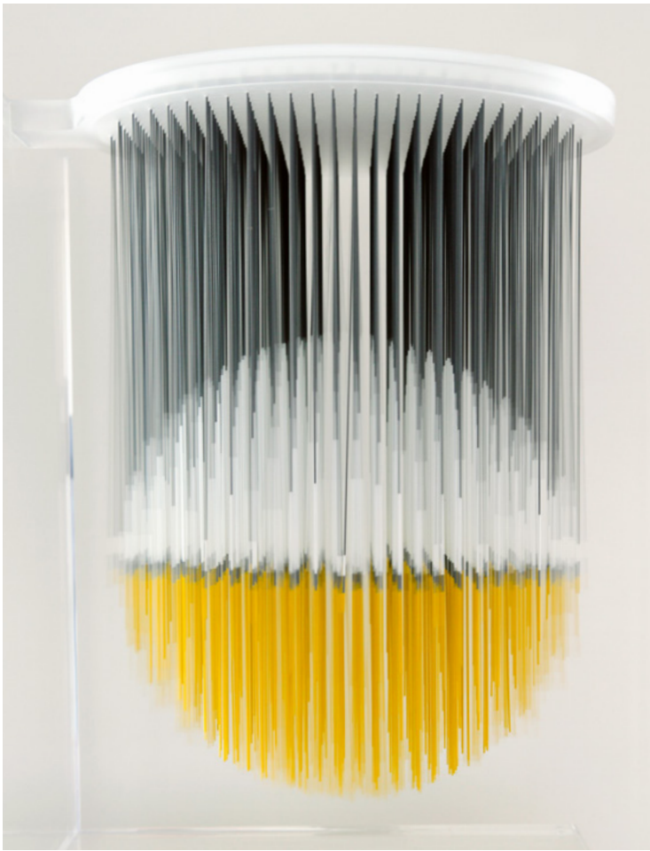
Jesús-Rafael Soto , Maquette Esfera theospacio 1989 - Plexiglas, métal peint - 53 x 34 x 40 cm - Edition AVILA- Paris, 2008 Collection privée © Jesús-Rafael Soto, ADAGP, Paris - 2021