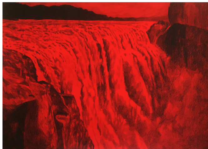
Myriam Mecheta, 2019 Hammam meskoutine 42 x 60 cm encre et crayon sur papier

*Au-dessus des barbelés Des cœurs bombardés