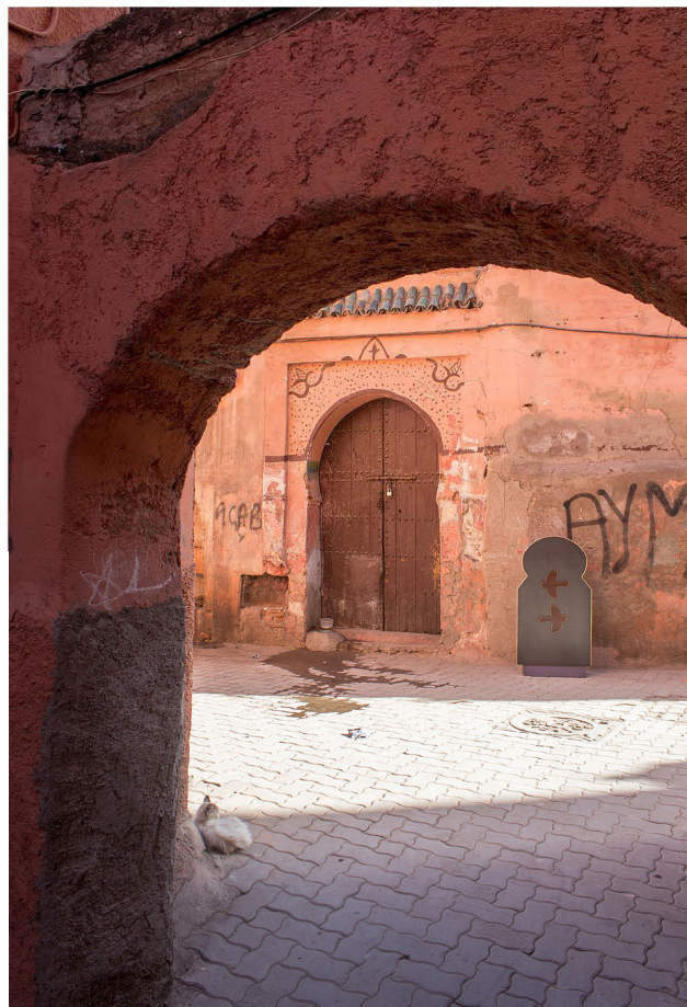
Bab Zerzura ou the art of not getting lost, Antonin Gerson Métal, cuivre, clé / Tirages photographiques 120x70cm 2019

Une ascension – tant horizontale que verticale - qui a à voir avec le dépassement de soi. Une appréhension - dans son acception d'apprentissage et de compréhension, un passage de la relation que nous avons au voyage à celle de conscience de la relation au monde. Ce dépassement, ce déplacement nous permet d'accéder à un état de conscience autre, différent, qui nous transcende. Il nous donne matière à réfléchir, à penser, à ressentir.