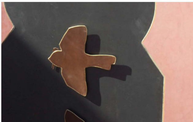
Bab Zerzura ou the art of not getting lost, Antonin Gerson Métal, cuivre, clé / Tirages photographiques 120x70cm 2019