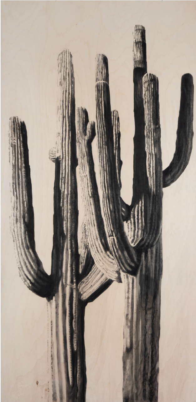
Pascale Rémita, Grenn heart, 2018 Fusain sur bois 250 x 122 cm

À TRAVERS LA MONSTRATION ET LA JUXTAPOSITION DES OEUVRES DE L'ENSEMBLE DE CES ARTISTES, MEHDI-GEORGES LAHLOU PROPOSE UNE PROMENADE ARTISTIQUE QUI FERA VOYAGER LE VISITEUR DANS DES CONTRÉES – PENSÉES, SENS, IMAGINAIRES... – ET L'EMMÈNERA DANS UN AILLEURS RÉFLEXIF.