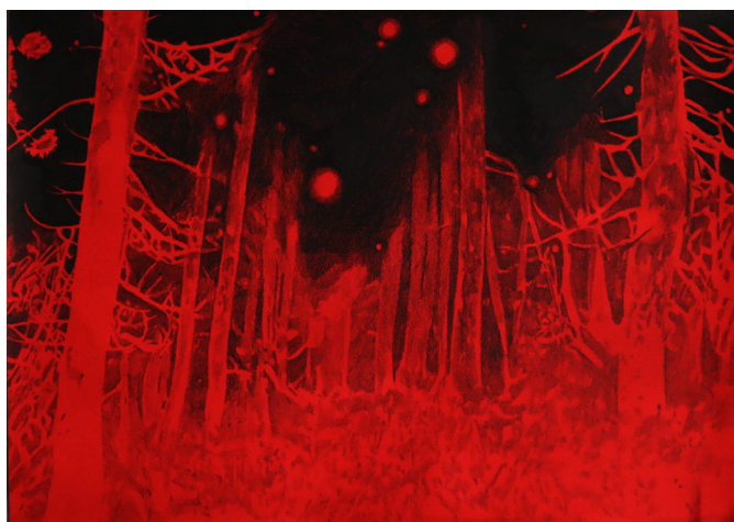
Myriam Mecheta, 2019 The deep forest 42 x 60 cm