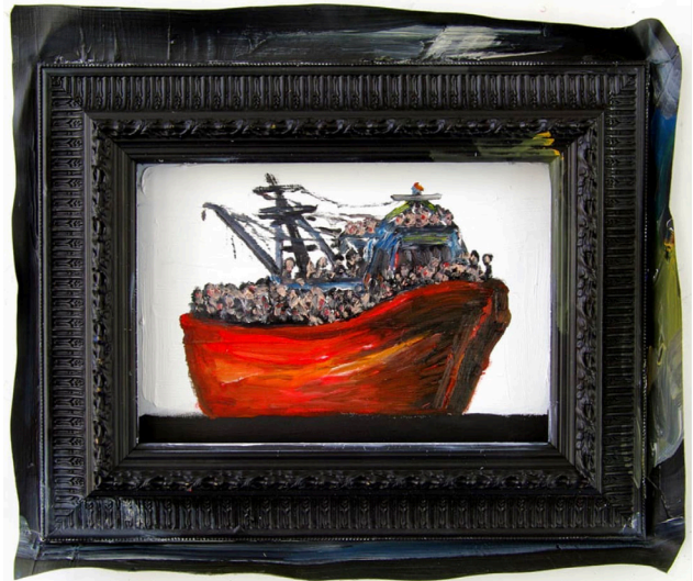
Raphaëlle Ricol, Saturation, 2014, Courtesy de l'artiste et Patricia Dorfmann

In fine l'exposition collective montre la relation de l'homme au monde et y révèle son lien étroit. Il permet au corps et à tous nos sens de ressentir la notion de Voyage finalement homérique.