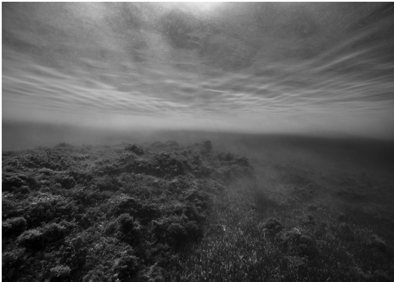
Nicolas Floc'h, Paysages productifs, Bulles, pH 7.8, -8m, zone acide, Vulcano, Sicile, 2019, Tirage Carbone 79,5 x 110 cm, Courtesy Galerie Maubert (Paris)