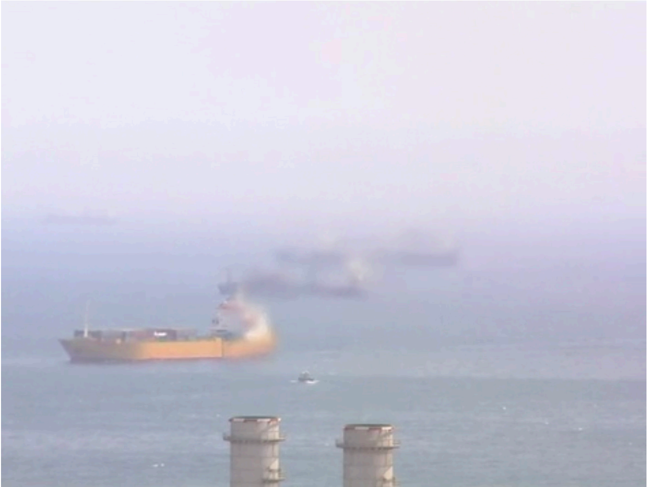
Katia Kameli, Dissolution, 2009 Vidéo, 3mn50 en boucle/loop

*Paroles : Jean-Michel Rivat et Dominique Dubois Chantée : par Desirless