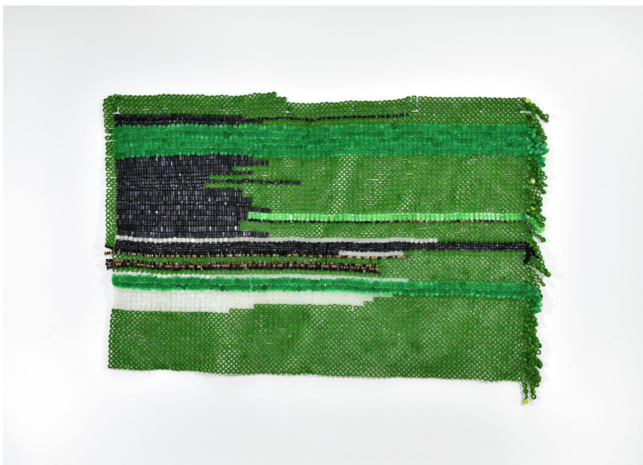
Moffat Takadiwa, Hashtag this f/ag, 2020 Touches de clavier en plastique, bouchons de bouteille en plastique 193 x 310 cm

LA MAISON DU CHIFFRE, SIÈGE DE L'ORDRE DES EXPERTS-COMPTABLES DE PARIS ÎLE-DE-FRANCE, EST HEUREUSE D'ACCUEILLIR L'EXPOSITION VOYAGE, VOYAGE POUR LAQUELLE LE COMMISSAIRE MEHDI-GEORGES LAHLOU CREUSE PLUS ENCORE SA RÉFLEXION DÉJÀ ENGAGÉE AVEC À GORGE SÈCHE APRÈS LA TRAVERSÉE AUTOUR DE LA NOTION DU DÉPLACEMENT.