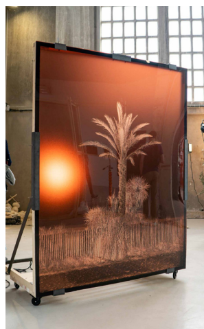
Gabriel Moraes Aquino, Negative Palm I, 2021 Impression UV sur Plexiglas transparent, structure bois et acier, roulettes, projecteur. 220 cm x 160 cm x 100 cm 310 cm