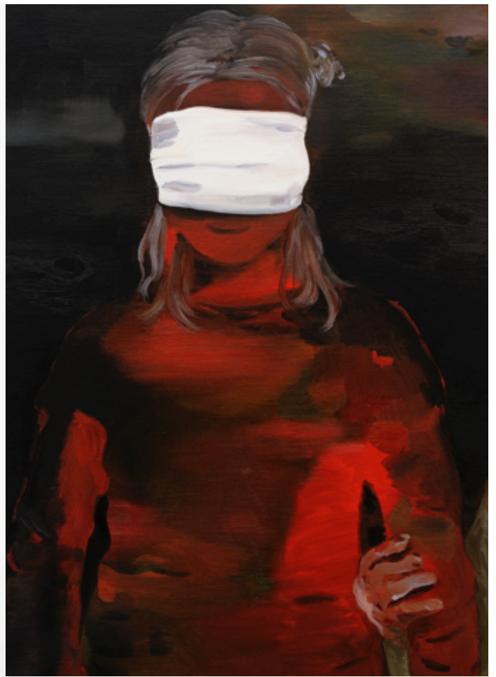
Haut : De la série Étendu , 2015, Lavis d'encre sur papier, 174 x 255 cm, collection privée Bas (de gauche à droite) ; Françoise Pétrivitch, Sentinelle , bronze, 2015 / Françoise Pétrivitch, Nocturne , 2014, Huile sur toile, 80 x 60 cm, Courtesy Semiose galerie, Paris