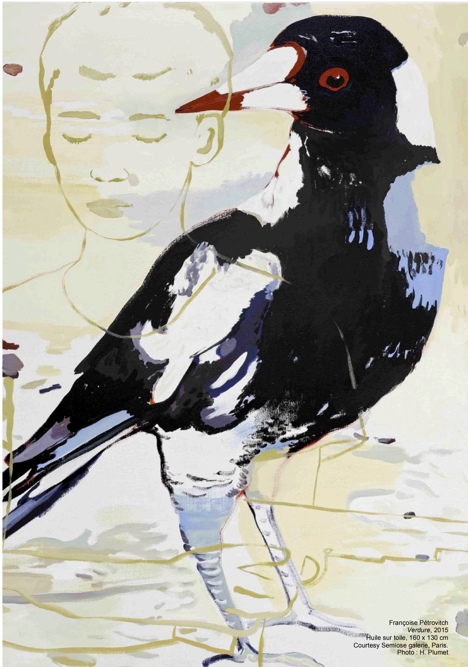
Françoise Pérovitch Verdure , 2015 Huile sur toile, 160 x 130 cm