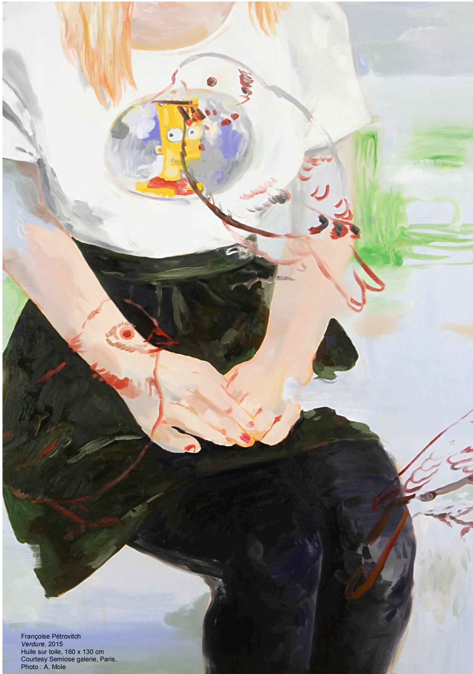
Françoise Pétrovitch Verdure , 2015 Huile sur toile, 160 x 130 cm