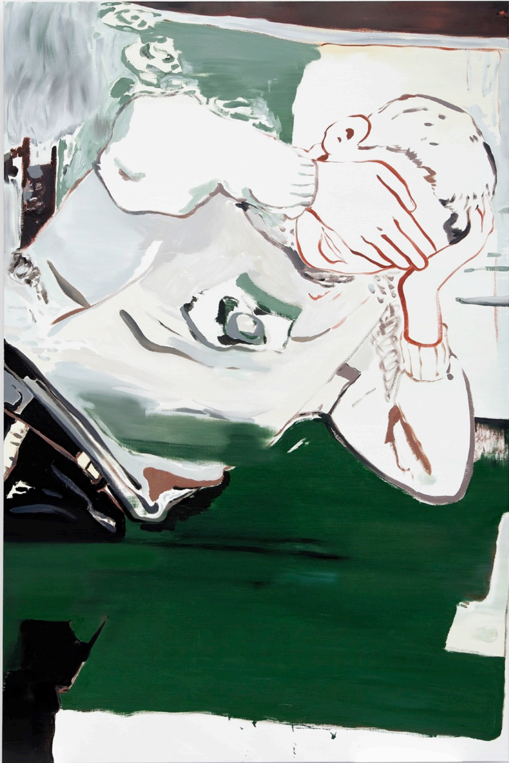
Françoise Pérovitch Sans titre , 2015, Huile sur toile, 240 x 160 cm