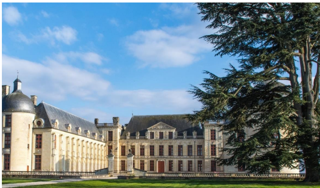
Le château d’Oiron

Le château d’Oiron a été édifié au XVI e et XVII e siècles par la famille des Gouffier. Au XVI e siècle, Claude Gouffier est grand écuyer des rois François I er et Henri II ; il aurait inspiré à Charles Perrault, le personnage du marquis de Carabas (1697). Peu avant 1550, il fait peindre, le décor d’une galerie de 55 mètres de long, exemple exceptionnel du style de l’Ecole de Fontainebleau, qui met en scène l’histoire de la guerre de Troie.