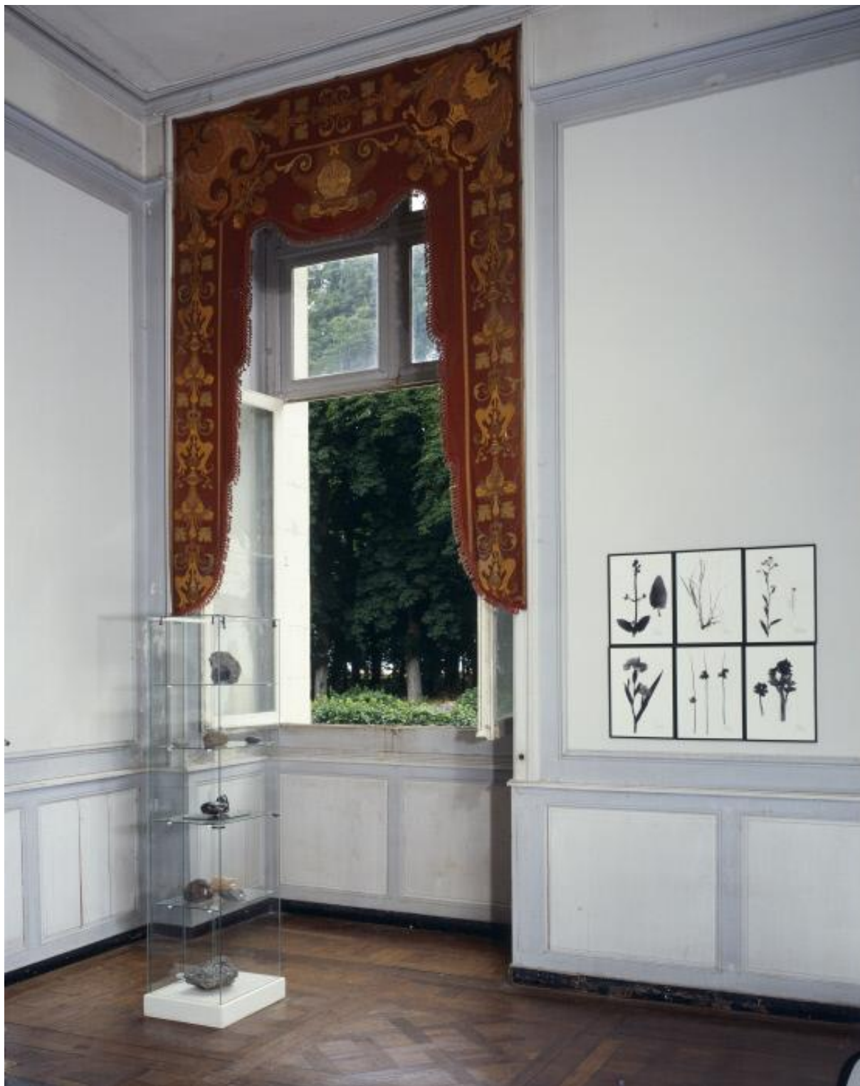
Cabinet d'Histoire naturelle, Paul-Armand Gette, Commande publique pour le château d'Oiron, Centre des monuments nationaux, collection CNAP