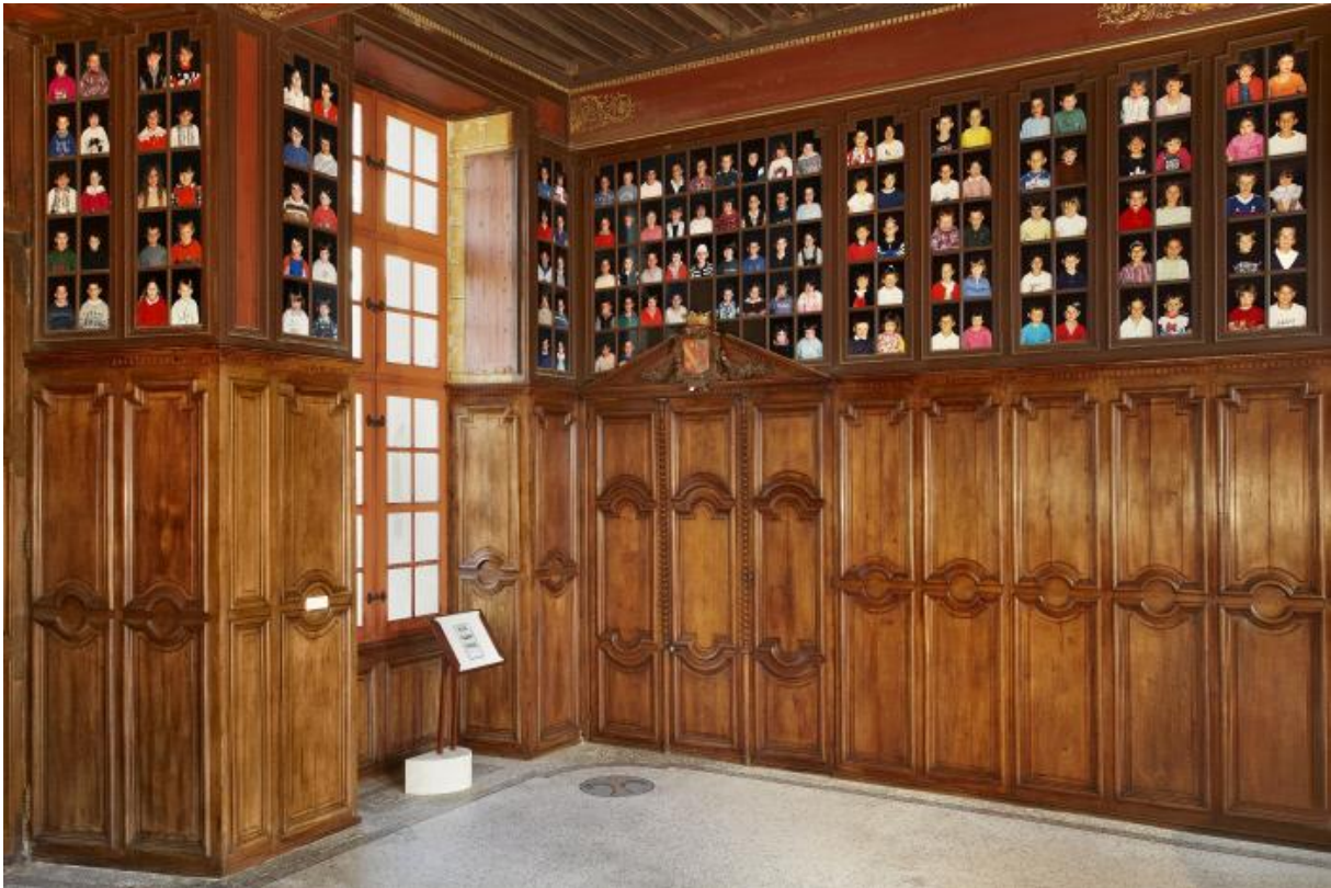
Vestibule d'entrée, Les écoliers d'Oiron, Christian Boltanski, Commande publique pour le château d'Oiron, Centre des monuments nationaux, collection CNAP, Photo © Laurent Lecat