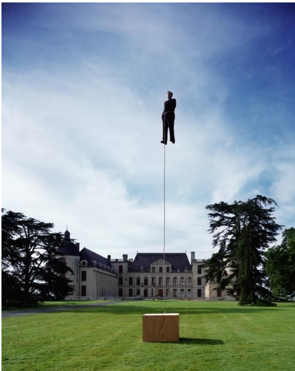
Philippe Ramette, Point de vue, 2002, Photographie, achat Centre des monuments nationaux, photo © Samuel Quenault