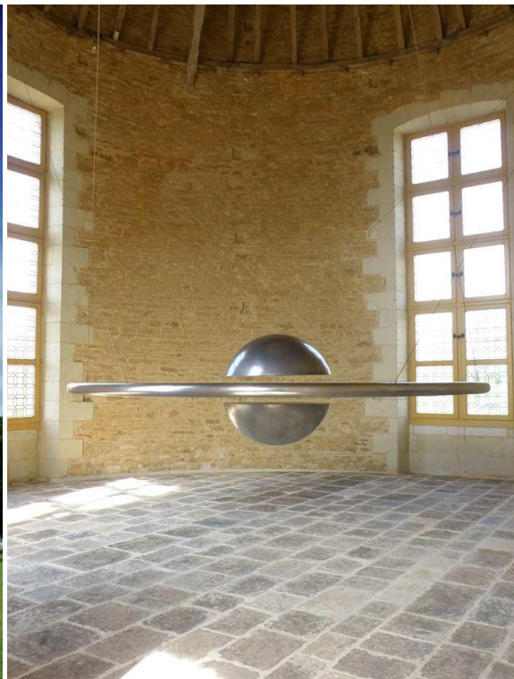
Salle de la Lévitacion, Tom Shannon, Decentre-Acentre , 1993, Commande publique pour le château d'Oiron, Centre des monuments nationaux, collection CNAP, Photo © Samuel Quenault