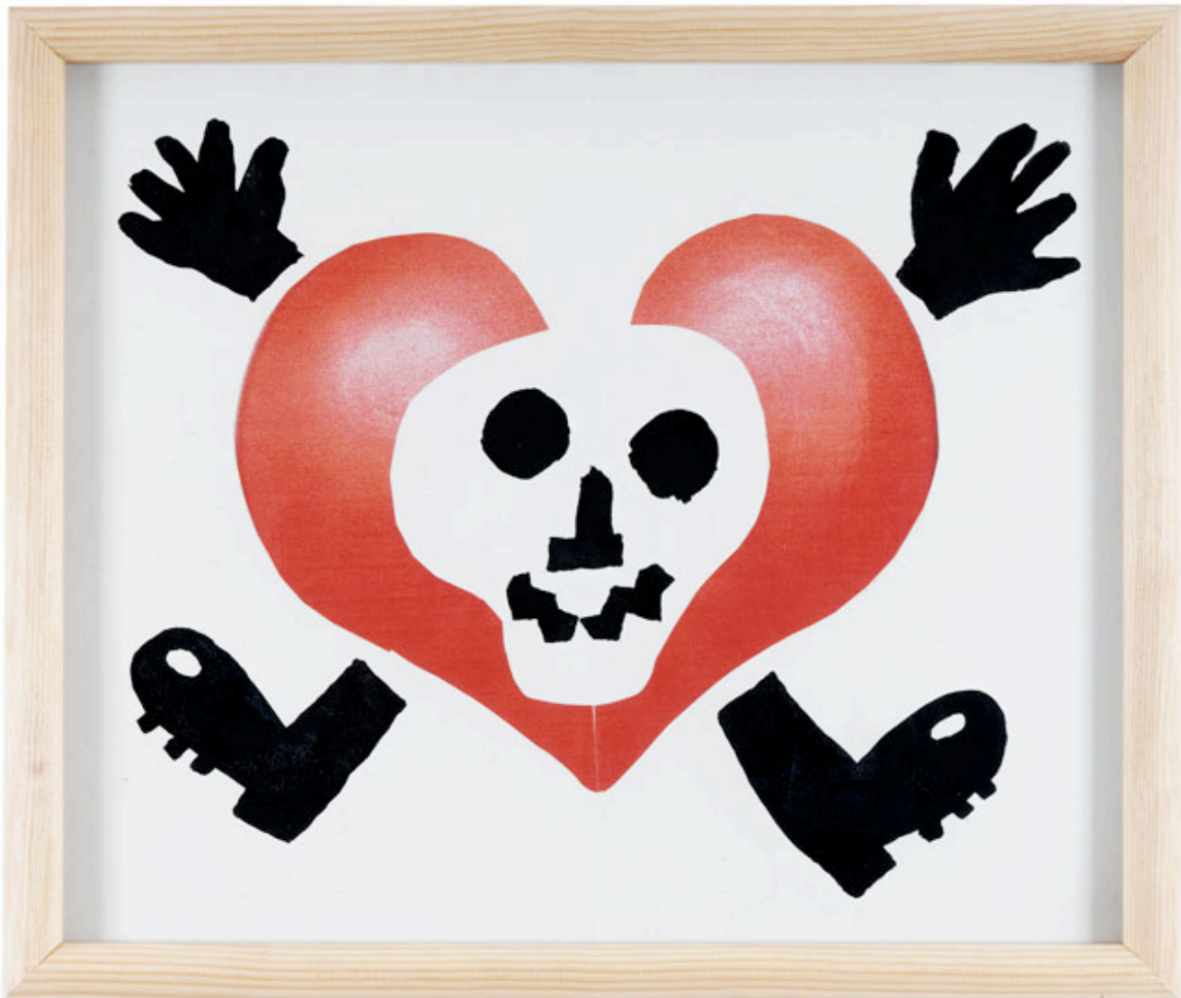
Taroop & Glabel Amour Amor, 2009 Encre de chine sur papier 42 x 55 cm pièce unique N° Inv. T&G-09-061