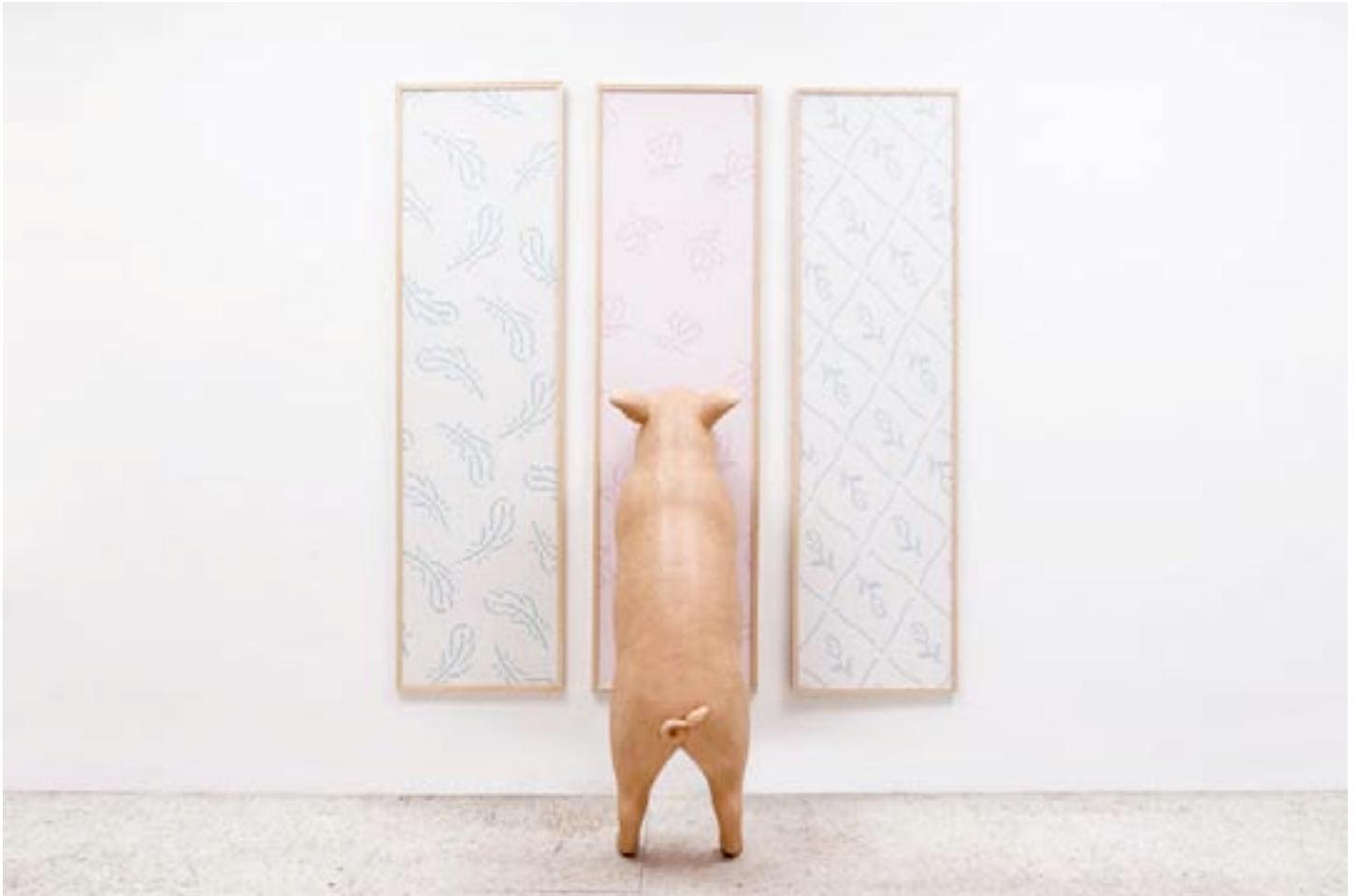
Taroop & Glabel Ravissement, 2012 Papier peint sur contreplaqué et porc en résine dimensions variables pièce unique N° Inv. T&G-12-001