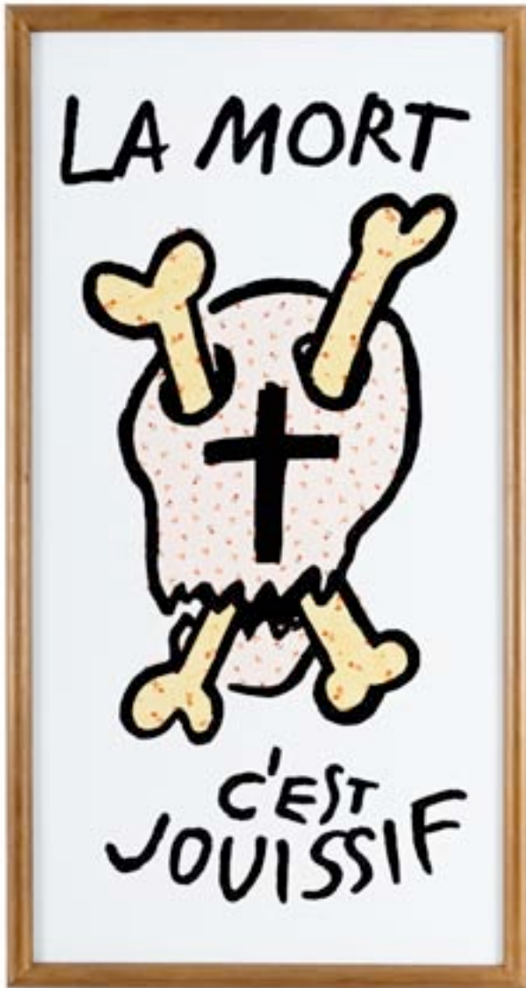
Taroop & Glabel La mort, c'est jouissif, 2012 Vénalyne sur contreplaqué 104 x 55 cm pièce unique N° Inv. T&G-12-002