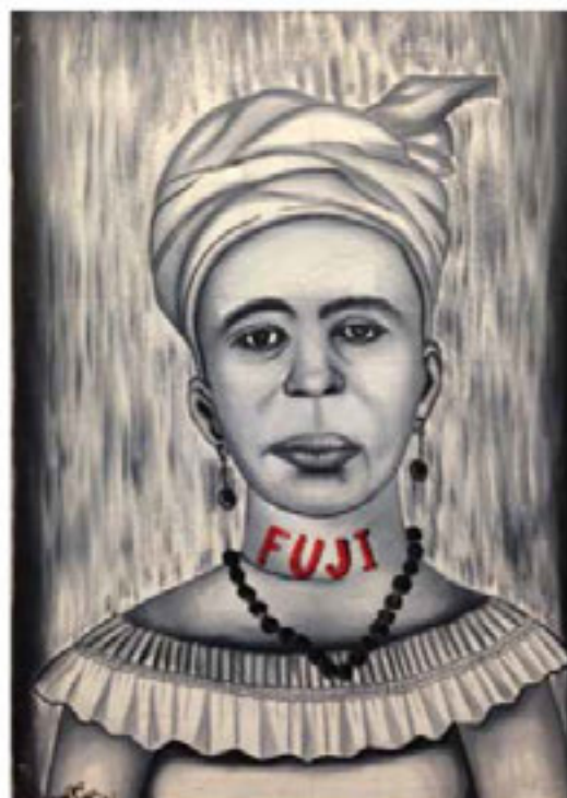
Présence Panchounette Portrait Kodak - Fuji , 1985 Glycéro sur toile 60 x 42,5 cm (x2)