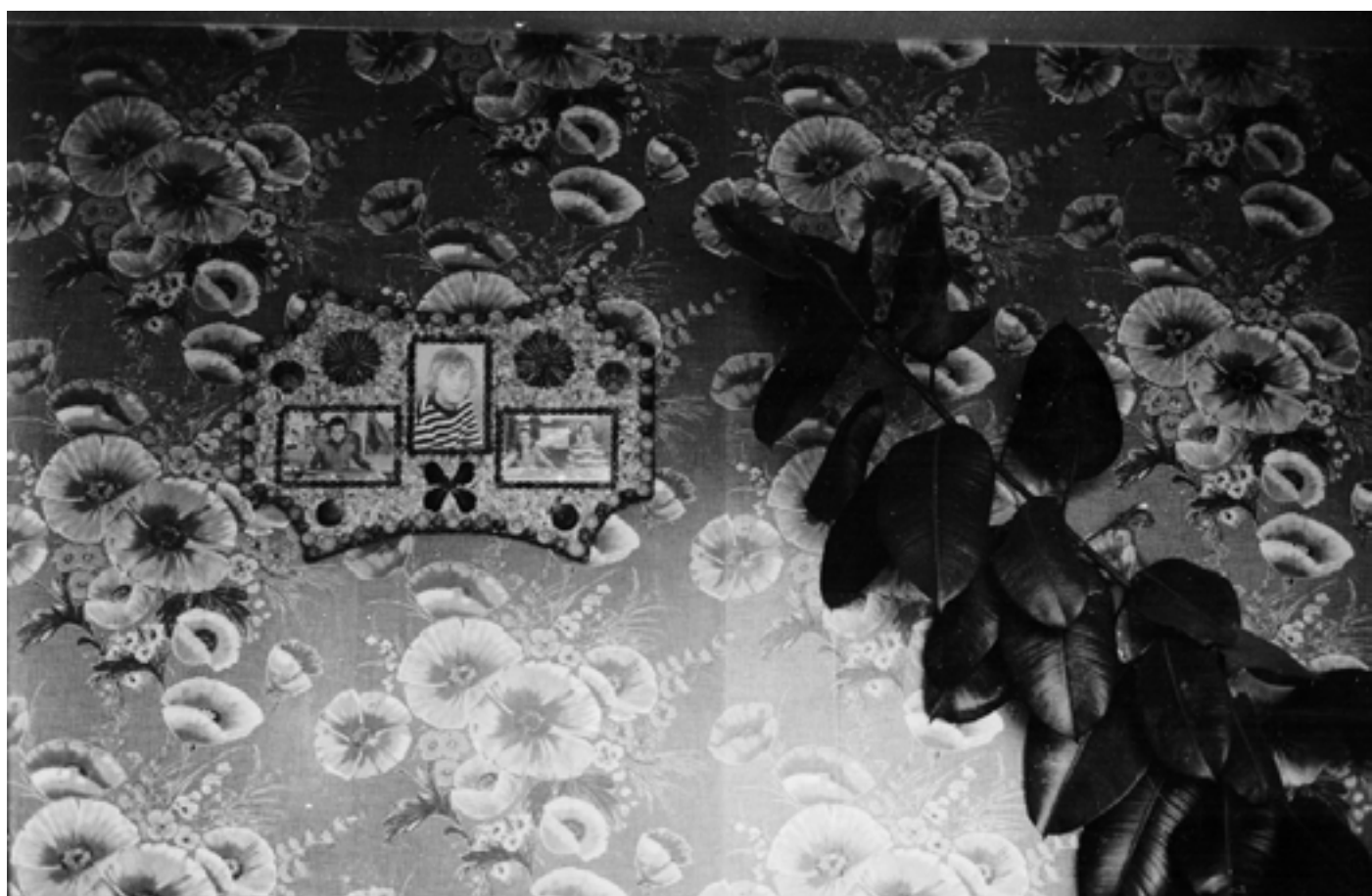
Présence Panchounette L'ordre décoratif - Comme une jungle de concepts , 1984 Tirage argentique original d'époque 18 x 24 cm