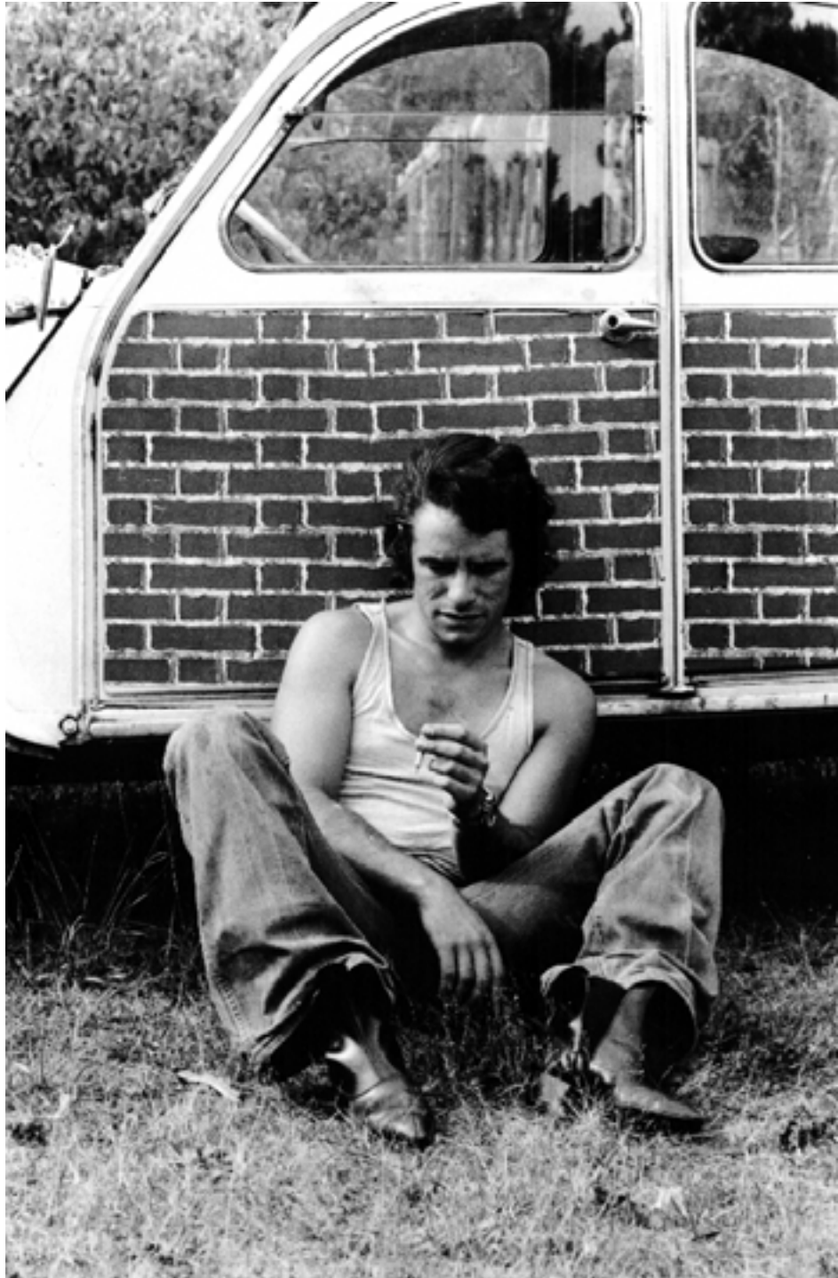
Présence Panchounette Let's twist against the wall III , 1973 Tirage argentique original d'époque 24 x 18 cm