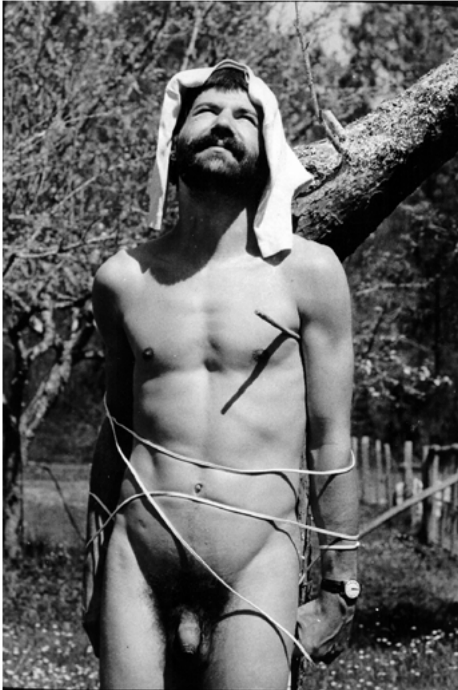
Présence Panchounette Le Martyr , 1974 Tirage argentique original d'époque 24 x 18 cm