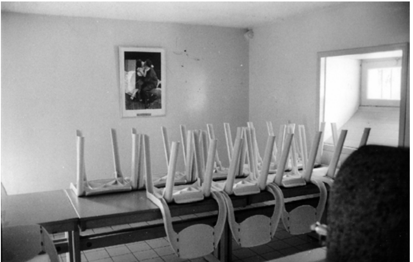
Présence Panchounette Le renversement de l'ordre décoratif , 1989 Tirage argentique original d'époque 18 x 24 cm