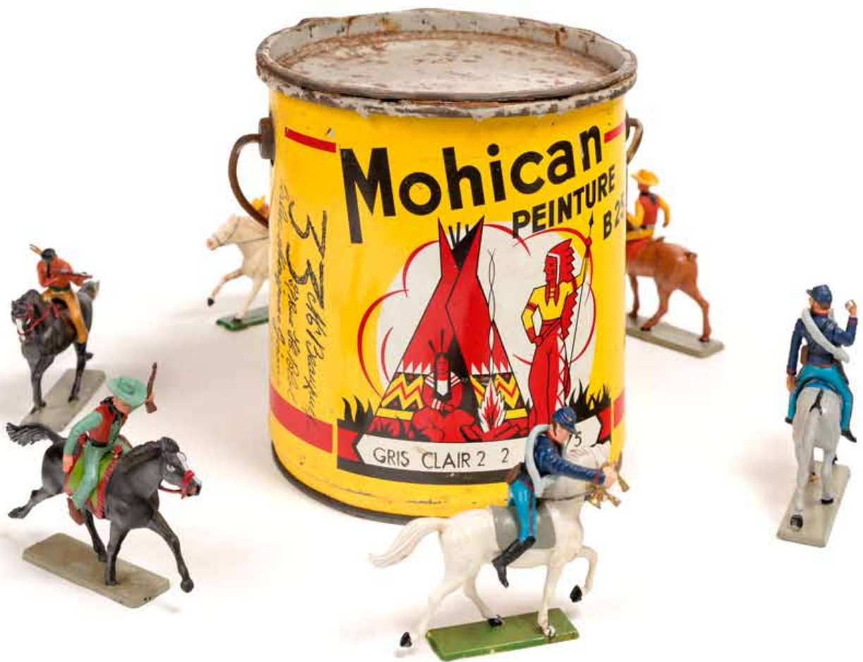
Présence Panchounette S'il n'en reste qu'un , 1987 Pot de peinture "Mohican" et figurines en plastiques 30 x 40 x 40 cm