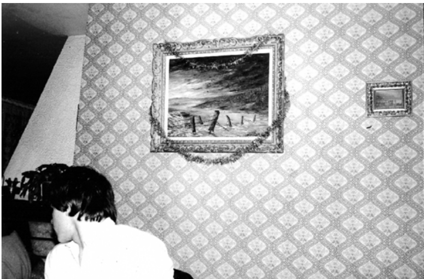
Présence Panchounette What - Merry Christmas ! , 1976 Tirage argentique original d'époque 18 x 24 cm