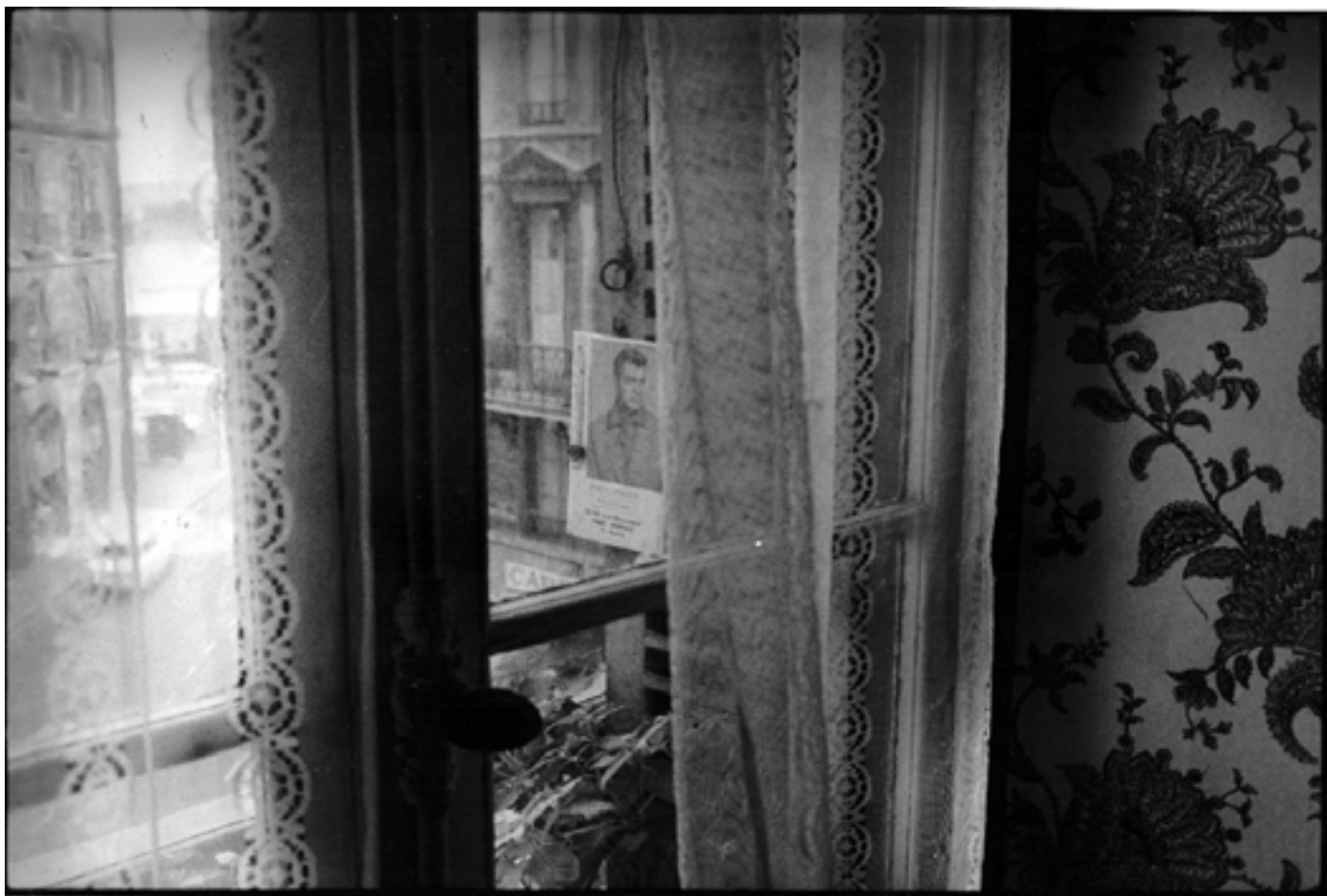
Présence Panchouette Jean Marais thermomètre , 1976 Tirage argentique original d'époque 18 x 24 cm