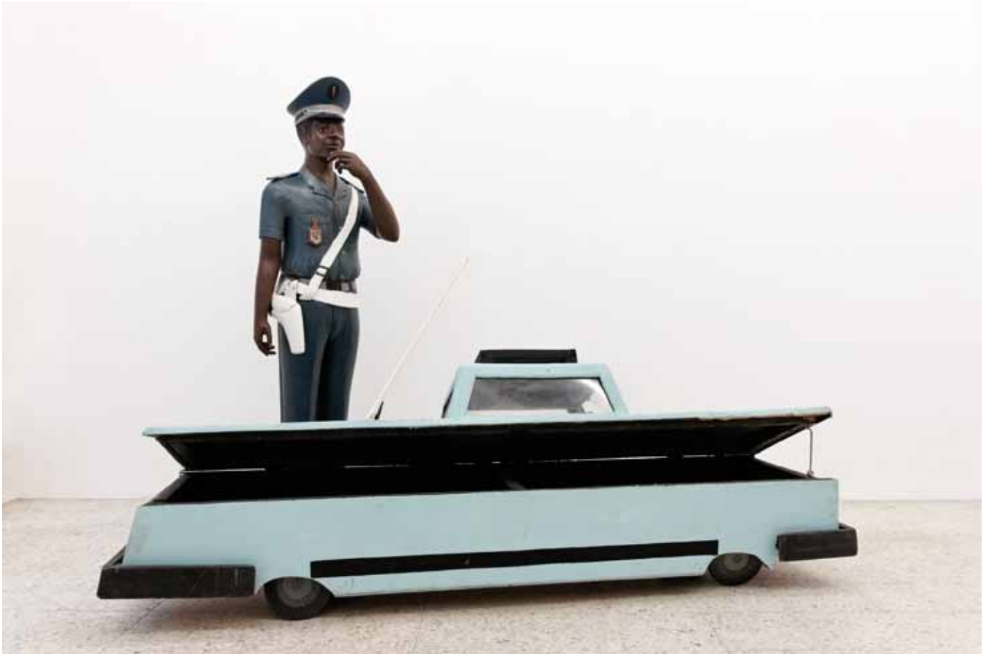
Présence Panchounette, Traffic , 1985. Wooden Coffin (made by Kane KWEI), Policeman wooden statue (made by DAMAS) and wooden elephants models, 57 x 205,5 x 52,5 cm (Coffin) + 168 x 53 x 48 cm (Policeman statue).