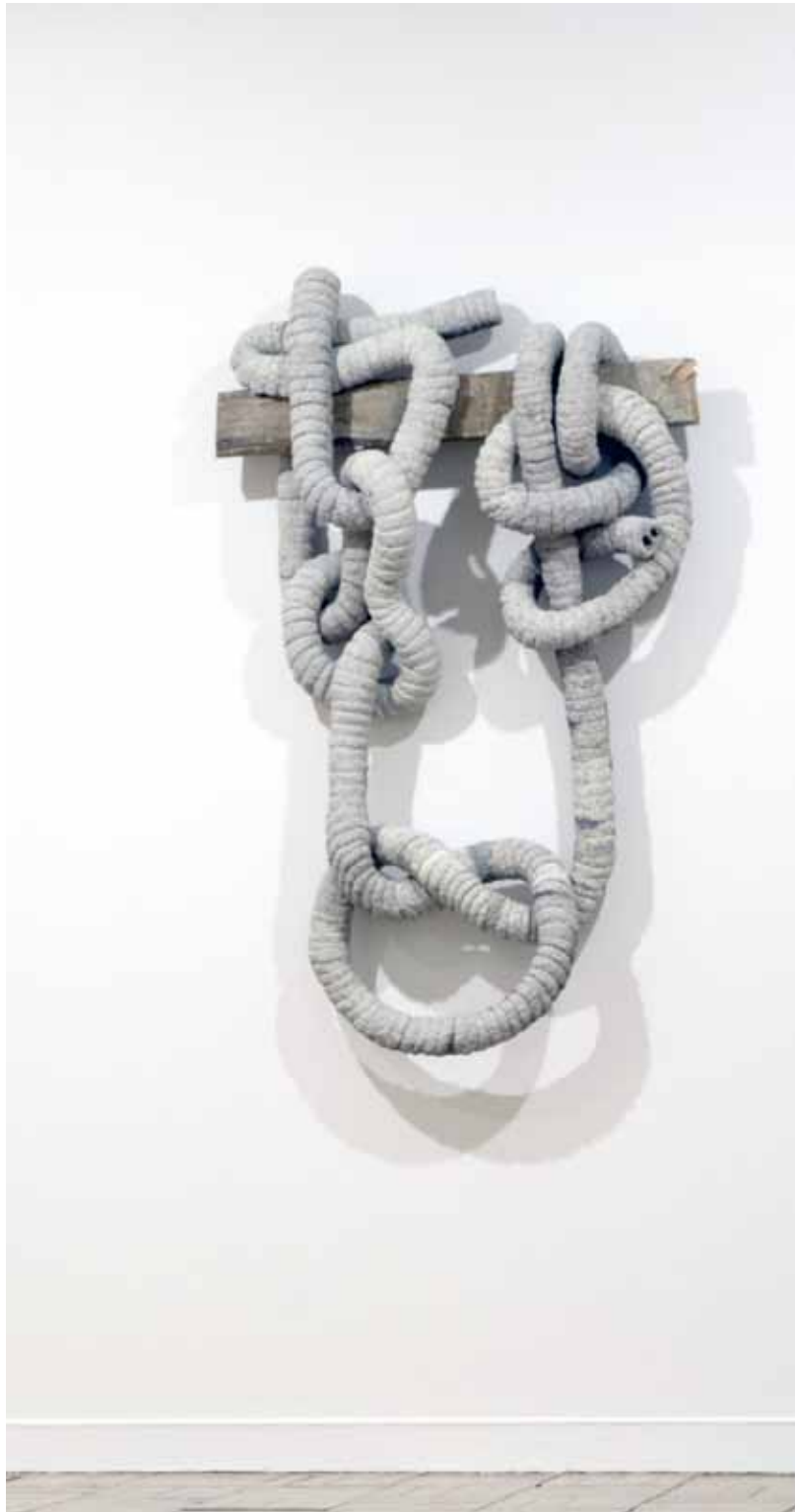
Laurent Le Deunff, Trunk knot 5 , 2012. Mixed materials, 180 x 110 x 35 cm.