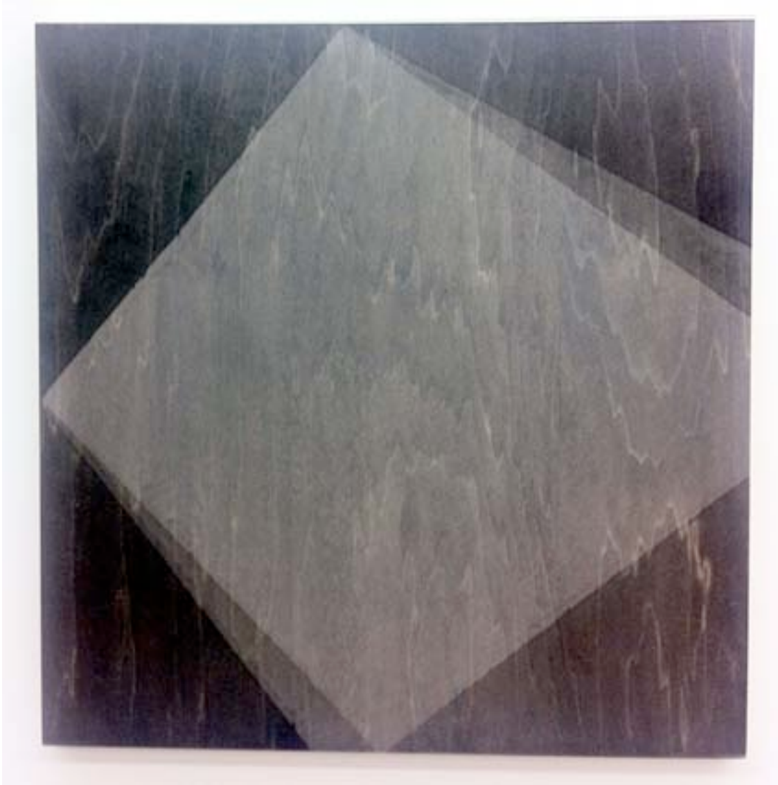
Bruno Rousselot X n°52, 2012 Dispersion sur bois 50 x 50 cm pièce unique Courtesy Semiose galerie, Paris. N° Inv. BR-12-001