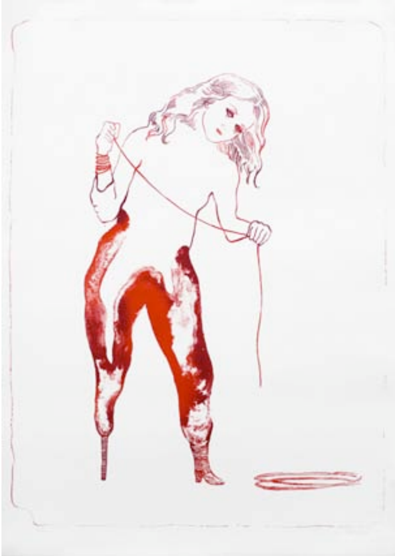
Françoise Pérovich Sur un pied, 2012 Lithographie 90 x 63 cm Edition de 30 N° Inv. FP-12-M01