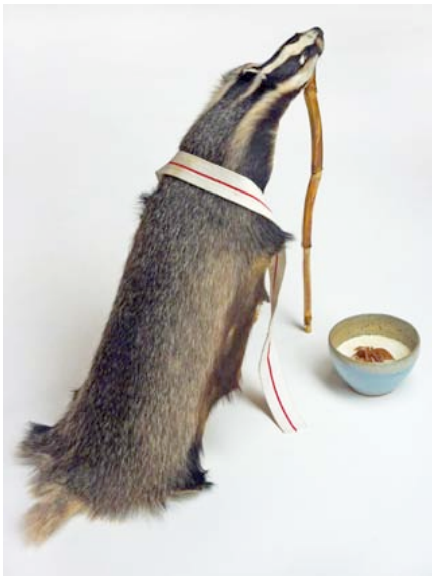
Jean-Marie Appriou Badger matin, 2011 peau de blaireau, ceinture de karaté, pied de maïs, céramique émaillée, rose des sables, plâtre 90x50x60cm pièce unique Courtesy semiose galerie, Paris. N° Inv. JMA-11-001