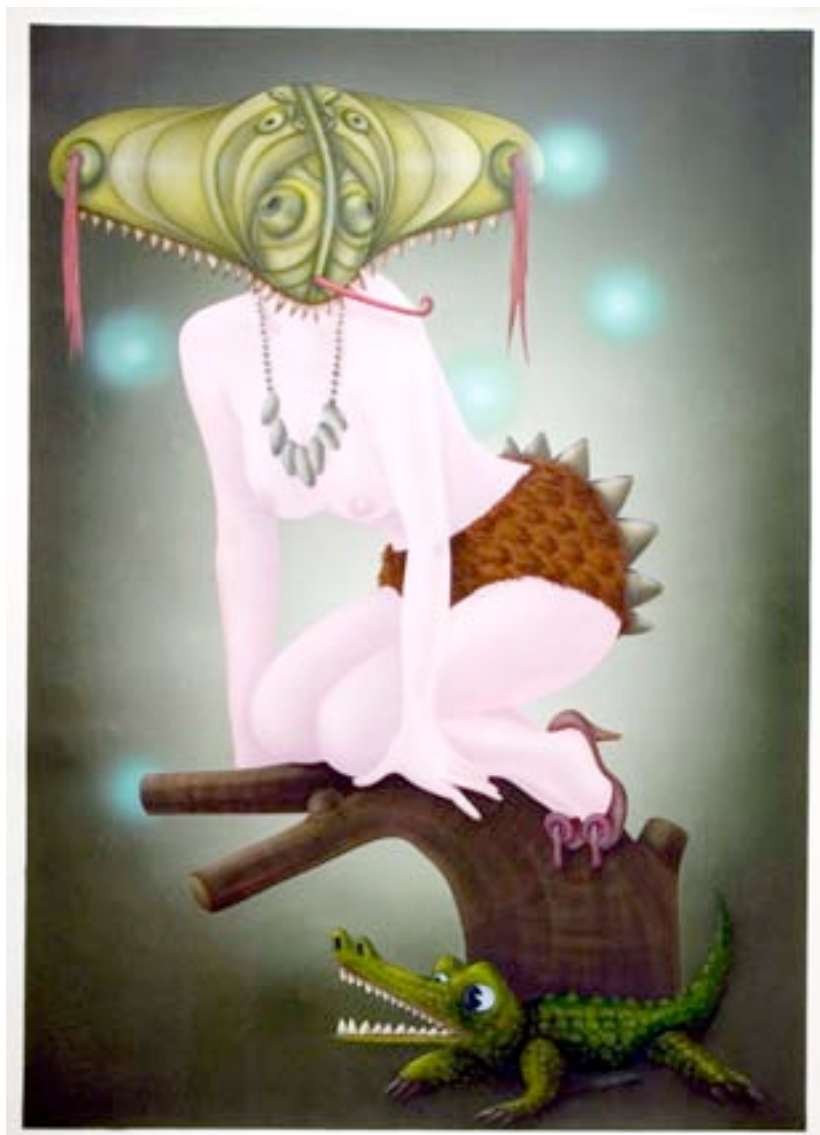
Hippolyte Hentgen Merry Melody (III), 2012 acrylique et encre sur papier Arches 158 x 114 cm pièce unique N° Inv. HH-12-001