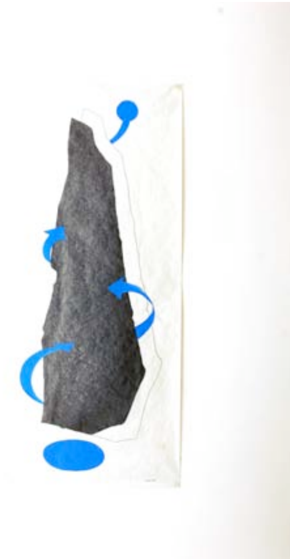
Thomas Lanfranchi L'oeil, 2005 Mine de plomb et collage 237 x 100 cm pièce unique N° Inv. TL-05-002